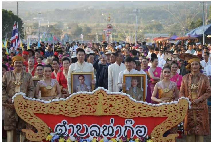
ร่วมพิธีไหว้สาปญาม้งราย (ถวายเครื่องสักการะ) ณ อนุสาวรีย์พ่อขุนเม็งรายมหาราช (ห้าแยกพ่อขุน)