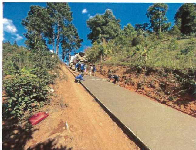
โครงการปรับปรุงถนนดินลูกรังเป็นถนนคอนกรีตเสริมเหล็กสายหลัก หมู่ที่ ๒๖ เชื่อม หมู่ที่ ๒ และหมู่ที่ ๑๑