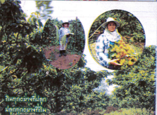
กินทุกอย่างที่ปลูก ปลูกทุกอย่างที่กิน

หมู่ที่ 14 ตำบลท่าก้อ อำเภอแม่สรวย จังหวัดเชียงราย เกษตรกรที่น้อมนำแนวคิดปรัชญาเศรษฐกิจพอเพียง มาเป็นแนวทางในการดำเนินชีวิตแบบพออยู่พอกิน ไม่เพิกขรึ้นไม่ฟุ้งเฟ้อจนจัดคิดขัดสน ใช้เฉพาะที่จำเป็น กินทุกอย่างที่ปลูก ปลูกทุกอย่างที่กิน มีการเตรียมความพร้อมและตั้งรับ การเปลี่ยนแปลง โดยคิดทางเลือกใหม่ ๆ ไว้รับมือกับปัญหาที่อาจจะเกิดขึ้น ระวังการเป็นหนี้สิน "ถ้าหนี้มาก ลำบากมาก" ประพฤติปฏิบัติตนตามจารีตประเพณี ทำนุบำรุงพระพุทธศาสนา และการใช้หลักธรรมาภิบาลทางชีวิต ความเป็นอยู่ของครอบครัวที่ดีขึ้นเรื่อย ๆ