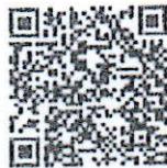
แบบรายงาน ครั้งที่ ๑