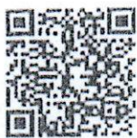
ข้อมูลการ ประชาสัมพันธ์